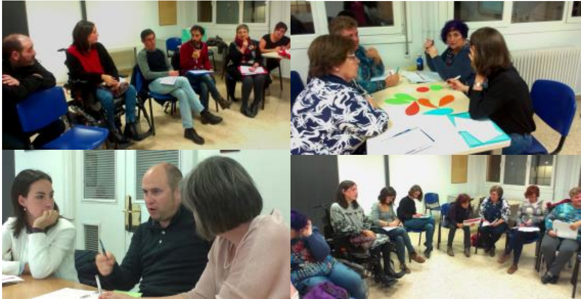
Antolatutako tailerretako parte-hartzaileak

Amaitzeko, aukera hau probestu nahi dugu gure esker ona emateko Erandioko Emakumeen eta Gizonen Berdintasunerako III. Planaren diseinuan parte hartu duten eragile, elkarte eta norbanako guztiei, txosten hau horien guztien ekarpenaren fruitua baita.